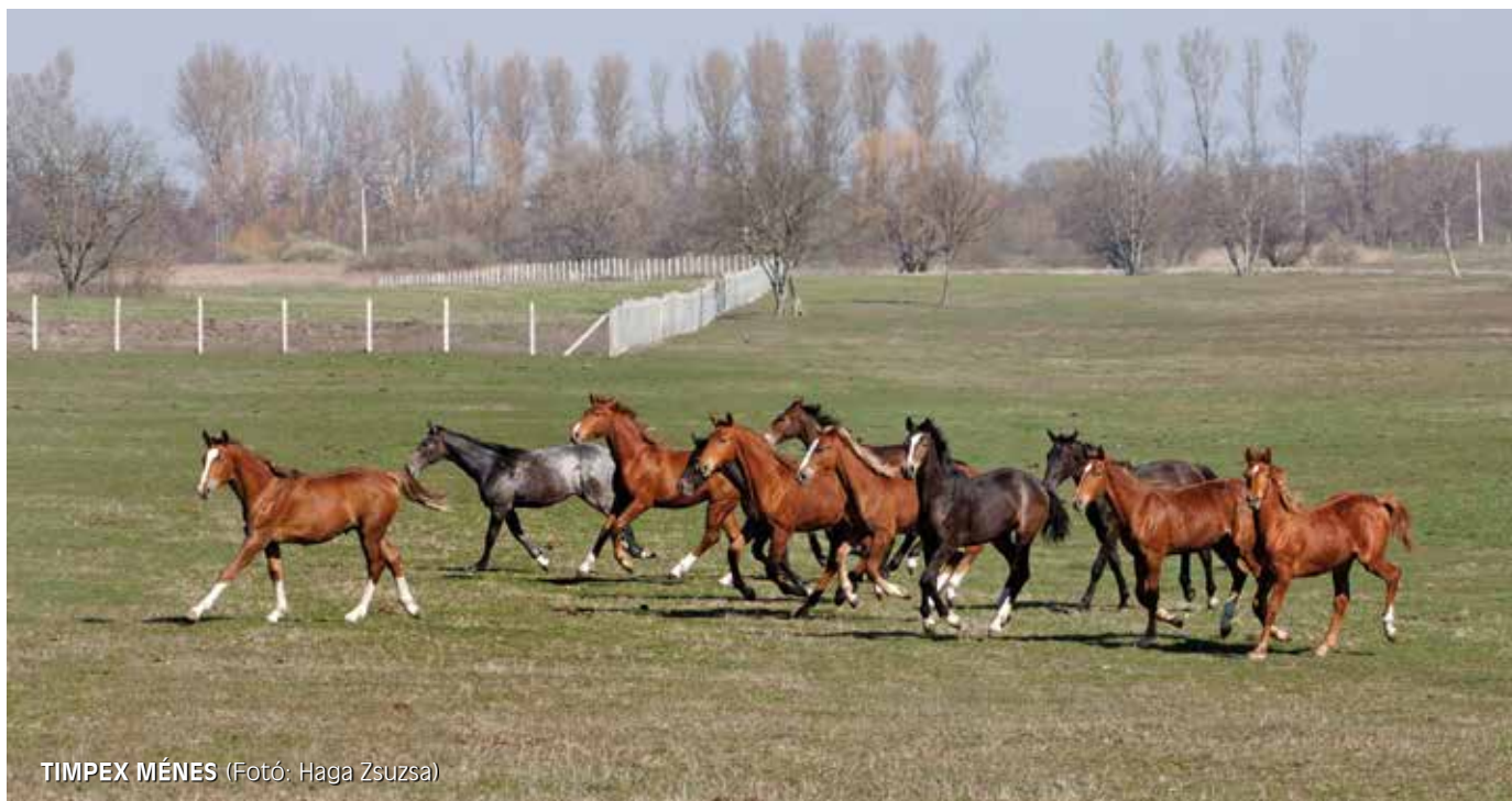
TIMPEX MÉNES